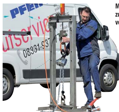
Mobiler Prüfrahm zur Funktionsprüfung von Hebezeugen

Übertragen Sie uns Ihre Prüfverantwortung!