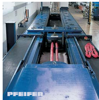
Stationäre Prüfbank bis 600t

Unser Qualitätsmanagementsystem ist zertifiziert nach DIN EN ISO 9001:2008 und wir arbeiten nach dem SCC-Zertifikat (Safety Certificate Contractors/Sicherheitszertifikat Kontraktoren).