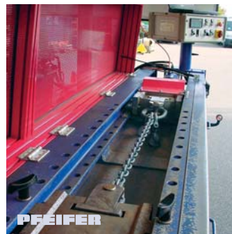
Mobile Zugbank bis 12t